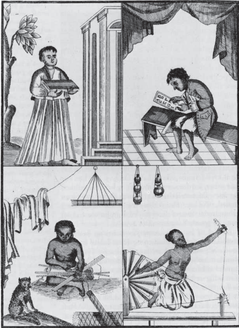
Skolebørn i Tranquebar. De 4 situationer afspejler bredden af det skolevæsen, der etableredes i Tranquebar i 1700-tallet. På de øverste to billeder ses børn fra den portugisiske skole, der oprettedes for koloniens europæiske og såkaldte indo-portugisiske børn. Nederst til venstre ses en tamisk dreng med tørrede palmeblade til brug for skrivning og en pige, der er i gang med bomuldsspinnning. Fra "Der Königl. Dänischen Missionarien aus Ost-Indien eingesandte ausführliche Berichte", Teil 3, 1735, s. 29 (Dansk Skolemuseum).